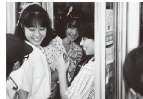
『若人よ いのちと愛のメッセージ』