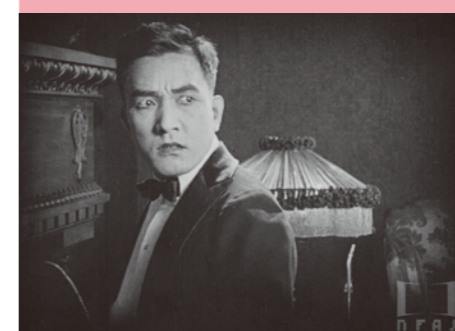
『男一匹の意地』