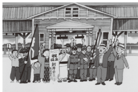
『最後の空襲 くまがや』© Sayoko Kinoshita

東京大空襲で孤児になった幸子は埼玉県熊谷市の叔父宅に身を寄せたが、1945年8月14日に空襲にあう。