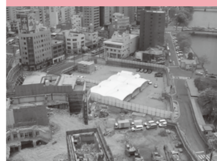
『広島の玄関口新時代』