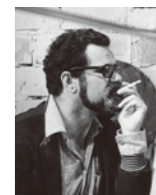
コンラート・ヴォルフ監督

ICH WAR NEUNZEHN 1968(DEFA) 119分 モノクロ DCP 監督/コンラート・ヴォルフ 19歳で連兵としてドイツを訪れたヴォルフの自伝的作品 4/24(金)18:30 5/2(土)11:00 5/3(祝)14:30